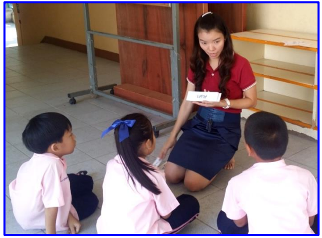
บัตรคำที่มีตัวสะกดไม่ตรงมาตรา มาตราแม่ กกด