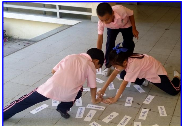
นักเรียนทำกิจกรรมเล่นเกมการอ่านคำ ที่มีตัวสะกดไม่ตรงมาตรา แม่กกด