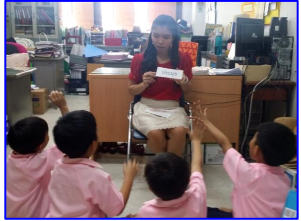
บัตรคำที่มีตัวสะกดไม่ตรงมาตรา แม่ กก แม่ กบ แม่ กน