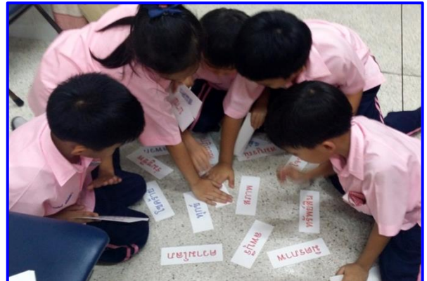
นักเรียนแข่งขันหาคำตามที่ครูบอก