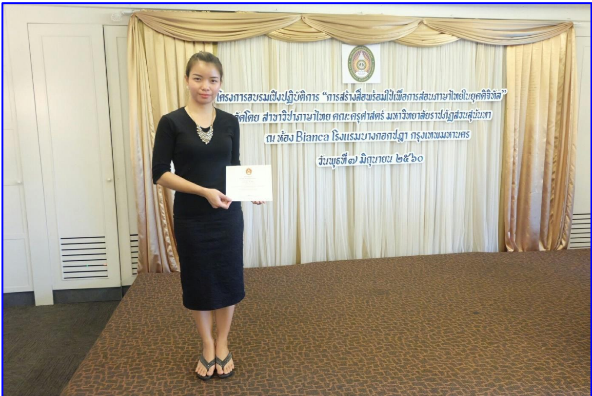
การอบรม “การสร้างสื่อพร้อมใจเพื่อการสอนภาษาไทยในยุคดิจิทัล”