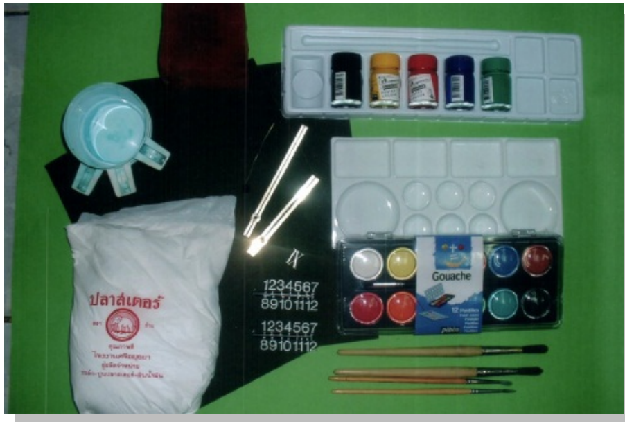
“อุปกรณ์การหล่อและระบายสีปูน พลาสติกอร์”