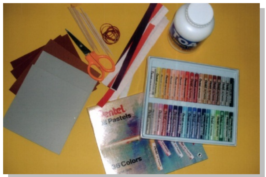
“อุปกรณ์จากระดาษสีรวมกับการใช้ สีชอล์ค”