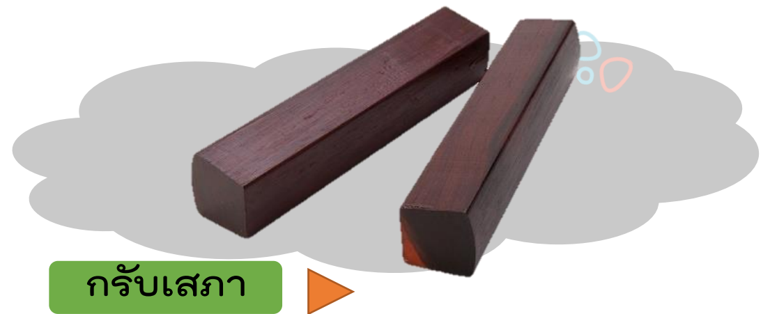
กรับเสภา

เสปามีกำเนิดจากการเล่านิทานหรือการเล่าเรื่องสู่กันฟังของชาวบ้านในยุคที่การอ่านออกเขียนได้ยังไม่แพร่หลาย โดยผู้เล่าจะมีศิลปะลีลาวาทศิลป์ในการเล่าของตนเอง จากภาษาพูดธรรมดาเปลี่ยนแปลงเป็นถ้อยคำสัมผัสสัมผัส แบ่งเป็นวรรคตอน มีจังหวะลีลาที่เรียกว่า “ กลอนเพลง ” มีกรับเสภาเป็นเครื่องประกอบจังหวะและวิวัฒนาการรูปแบบไปสู่การขับเสภาในที่สุด การขับเสภาเป็นที่รู้จักในราชสำนักมาตั้งแต่ครั้งกรุงศรีอยุธยา และในสมัยรัชกาลที่ ๒ จึงมีการบรรเลงปี่พาทย์เป็นเครื่องประกอบ เรียกว่า ปี่พาทย์เสภา