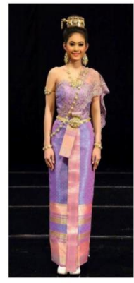
แบบที่ 4 แบบราตรีสโมสร