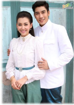
แบบที่ 2 แบบรัชกาลที่ 5