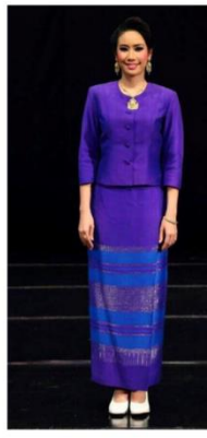
แบบที่ 3 แบบสากลนิยม