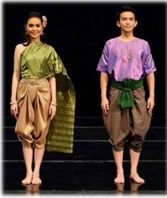
แบบที่ 1 แบบชาวบ้าน